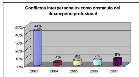
Gráfica No. 5