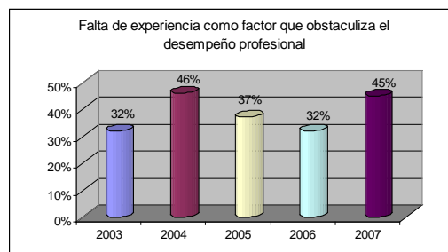
Gráfica No. 3