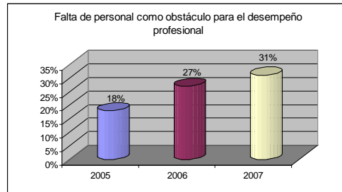
Gráfica No. 1